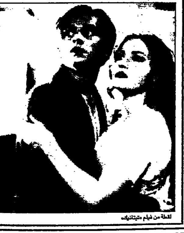
لقطة من فيلم «تيتانك»